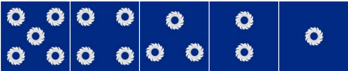
ธงจอมพลเรือ